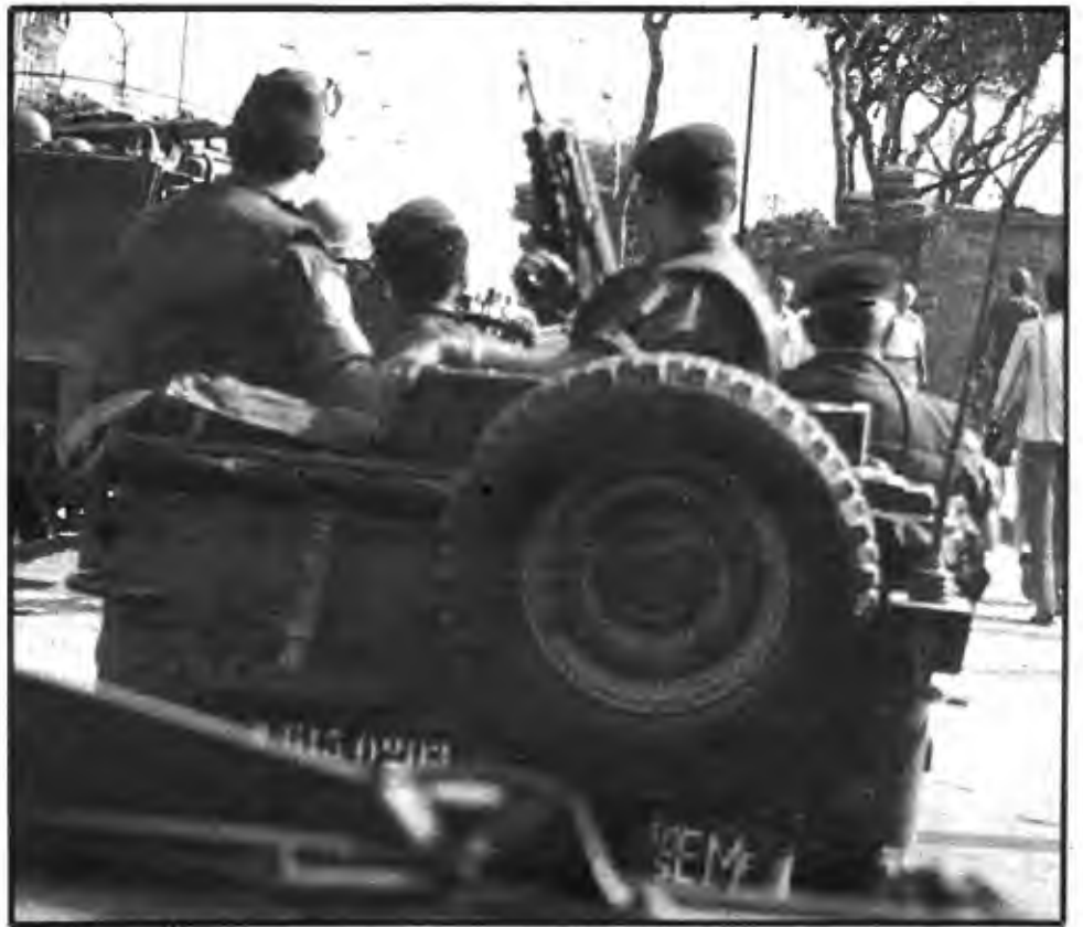
Patrouille française dans Beyrouth

Les prolétaires n'ont rien à voir avec la paix imposée par les princes arabes, la paix