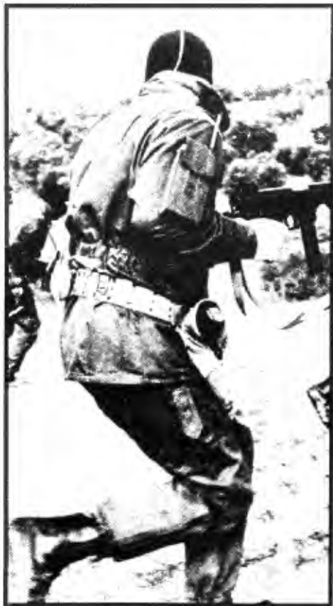
Les Nocs, unité « antiterroriste » d'élite, à l'entraînement...

Dans l'accomplissement de cette tâche et à la lumière des expériences faites, des résultats positifs et des autocritiques nécessaires, nous avons commencé à combler l'écart entre la résistance de classe et le projet politique révolutionnaire.